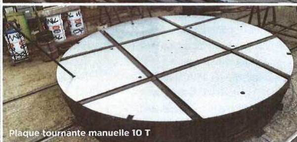
Plaque tournante manuelle 10 T

Dès qu'il y a besoin de déplacer de lourdes charges en milieux industriels, on fait souvent appel à ce spécialiste mondial de la conception et de la manutention sur rail. L'usine Placoplâtre de Cormeilles-en-Parisis, le site de traitement des eaux usées d'Achères, l'EPR de Flamanville, mais aussi les métros de Panama ou Doha au Qatar, portent la marque de l'entreprise. Des produits 100% made in France, conçus et réalisés par cette PME de 35 salariés sur son site de Persan, qui regroupe sur 8,5 hectares, bureau d'études, ateliers de chaudronnerie et de mécanique, magasin de stockage, stockage couvert et un embranchement ferroviaire relié à la gare de Persan Beaumont.