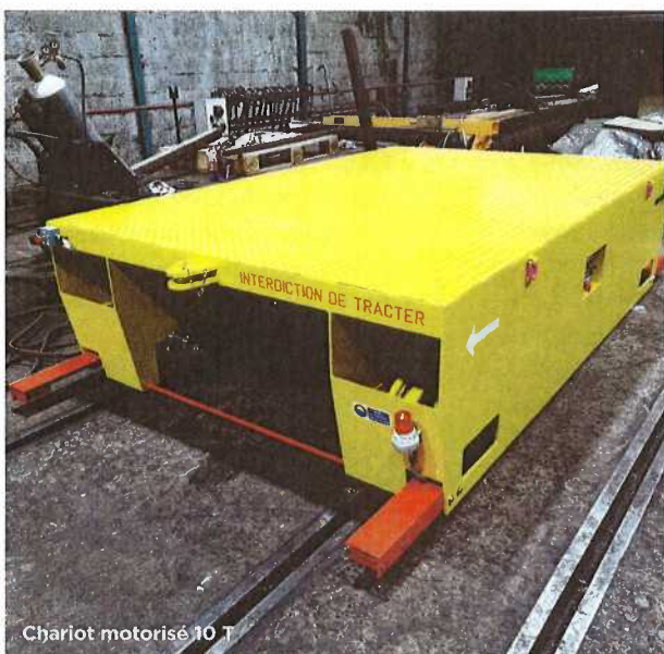
Chariot motorisé 10 T