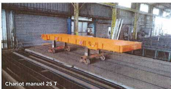
Chariot manuel 25 T