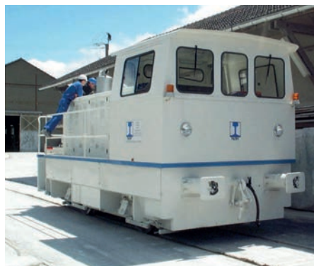
Locotracteur Fauvet Girel 300 CV radiocommandé Wireless remote control locomotive Fauvet Girel 300 HP