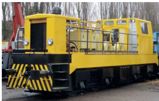
Locotracteur BB Fauvet Girel 72 t Locomotive BB Fauvet Girel 72 tons