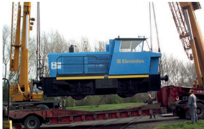
Déchargement par grues sur site Unloading by cranes on site