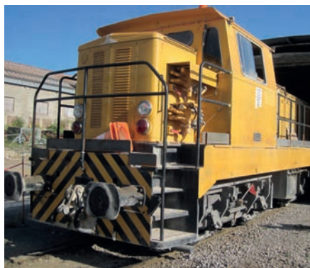
Locotracteur BB Fauvet Girel 72 t Locomotive BB Fauvet Girel 72 tons