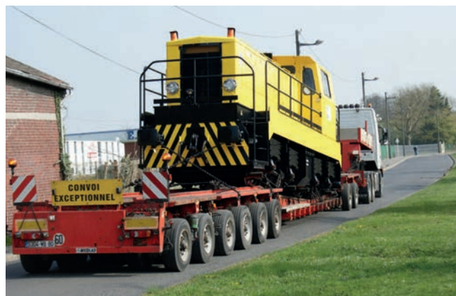
Livraison par convoi exceptionnel d'un locotracteur rénové Delivery of a refurbished locomotive by exceptional convoy