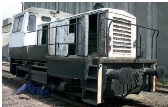
Locotracteur Fauvet Girel 300 CV Locomotive Fauvet Girel 300 HP