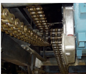
Réducteur et moteur double de Moyses CN 60 Gearmotor and double engine of a Moyses CN 60