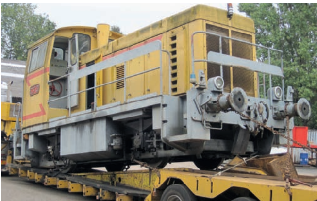
Chargement et déchargement par rampes directement sur les voies Loading and unloading directly on railway track