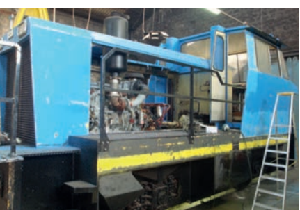
Locotracteur MTE TE 1521 Locomotive MTE TE 1521