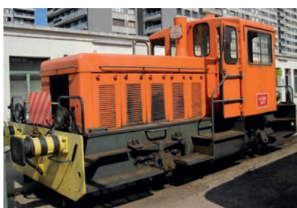
Locotracteur Y5000 SNCF Locomotive Y5000 SNCF