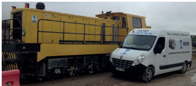
Maintenance sur site Maintenance on site

ENTRETIEN, RECONDITIONNEMENT ET RÉNOVATION DE MATÉRIEL D'OCCASION MAINTENANCE, RECONDITIONING AND RENOVATION OF USED MATERIAL