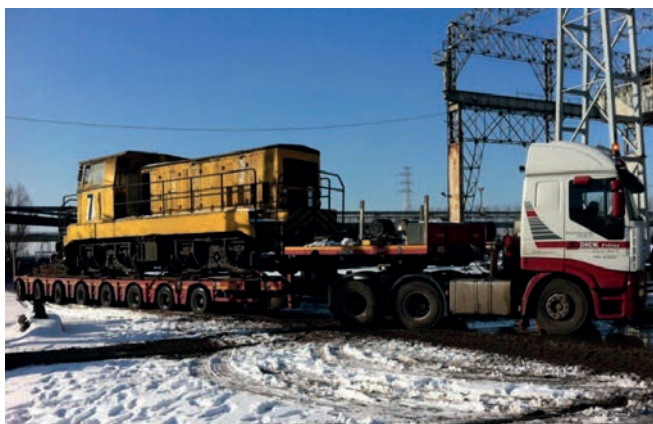
Expédition en convoi exceptionnel avant rénovation Transportation before refurbishment by exceptional convoy