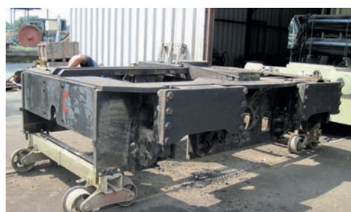
Chassis bogie de locotracteur BB Fauvet Girel 72 t Chassis of a bogie from locomotive BB Fauvet Girel 72 tons